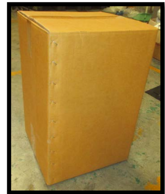
2nd Step/ขั้นตอนที่ 2