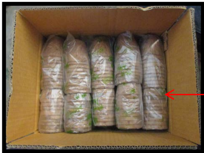
บรรจุ 2 ชั้น ชั้นละ 10 แพ็ค