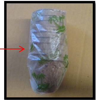
10 ชั้น / 1 แพ็ค